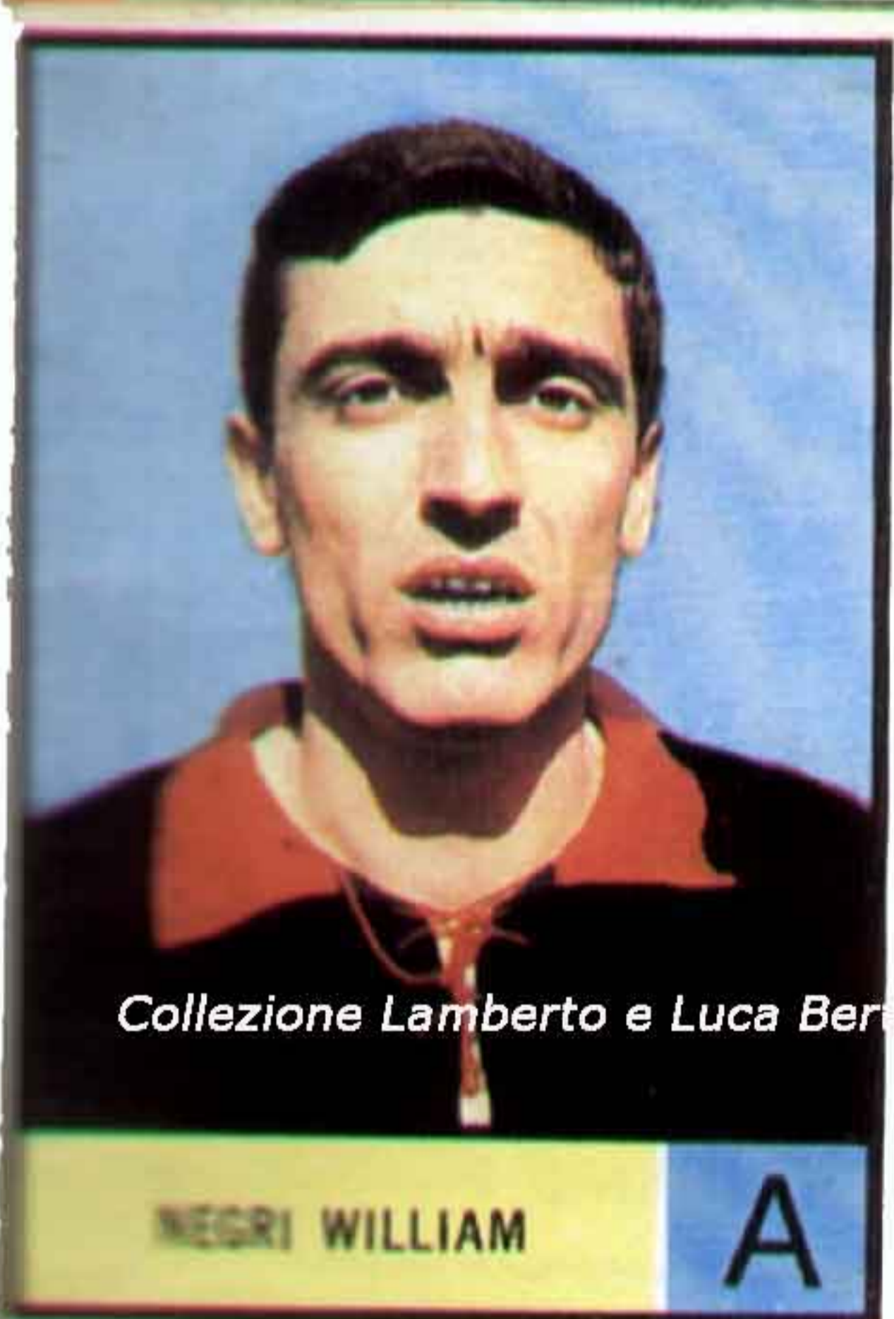
Collezione Lamberto e Luca Bertozzi - Collezione Lamberto e Luca Bertozzi -