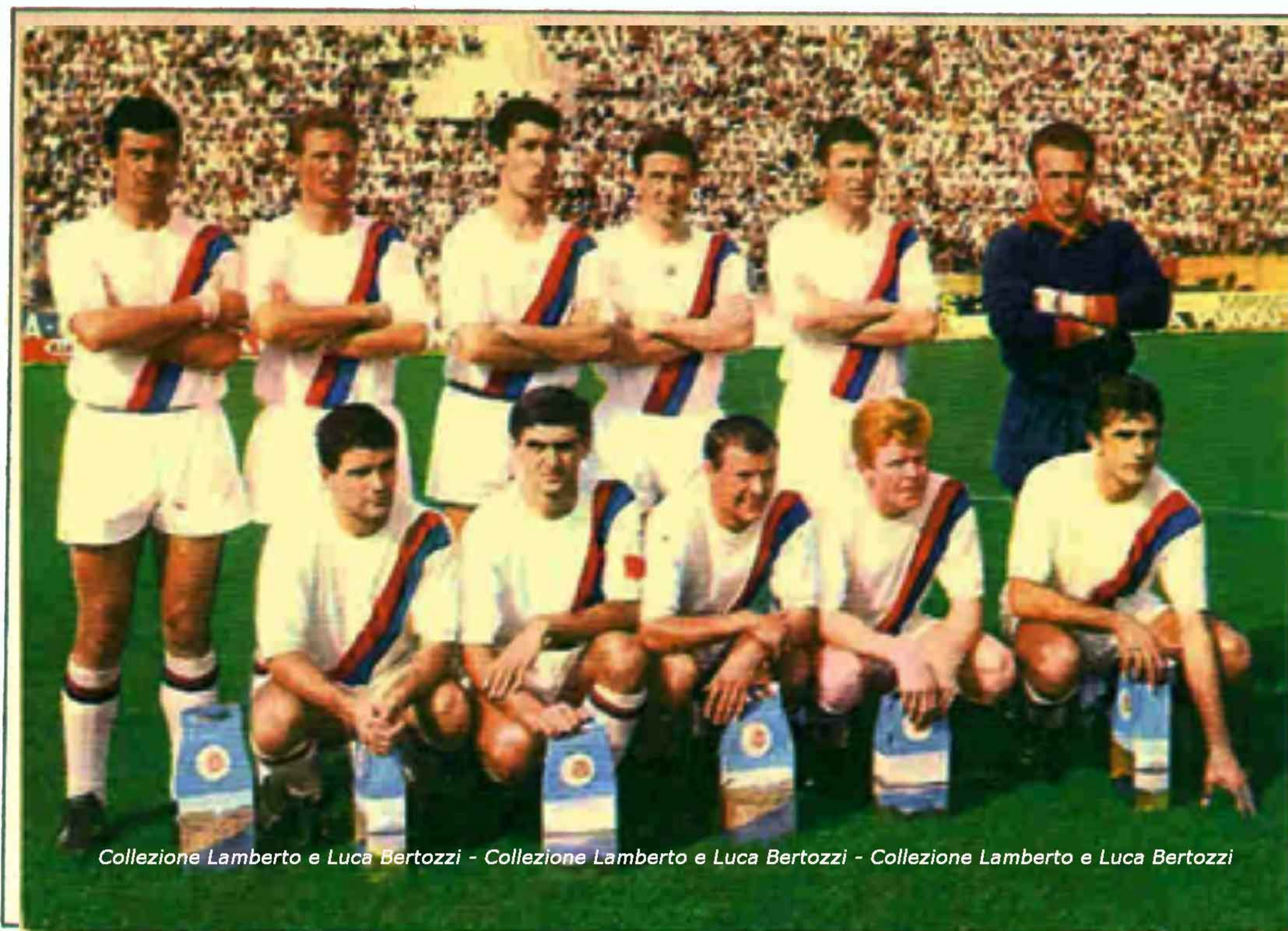
Collezione Lamberto e Luca Bertozzi - Collezione Lamberto e Luca Bertozzi - Collezione Lamberto e Luca Bertozzi

Ha partecipato una volta alla Coppa del Campioni, nel 1964-65, ma è stato eliminato al primo turno dall'Anderlecht per sorteggio dopo tre combattivissime partite.