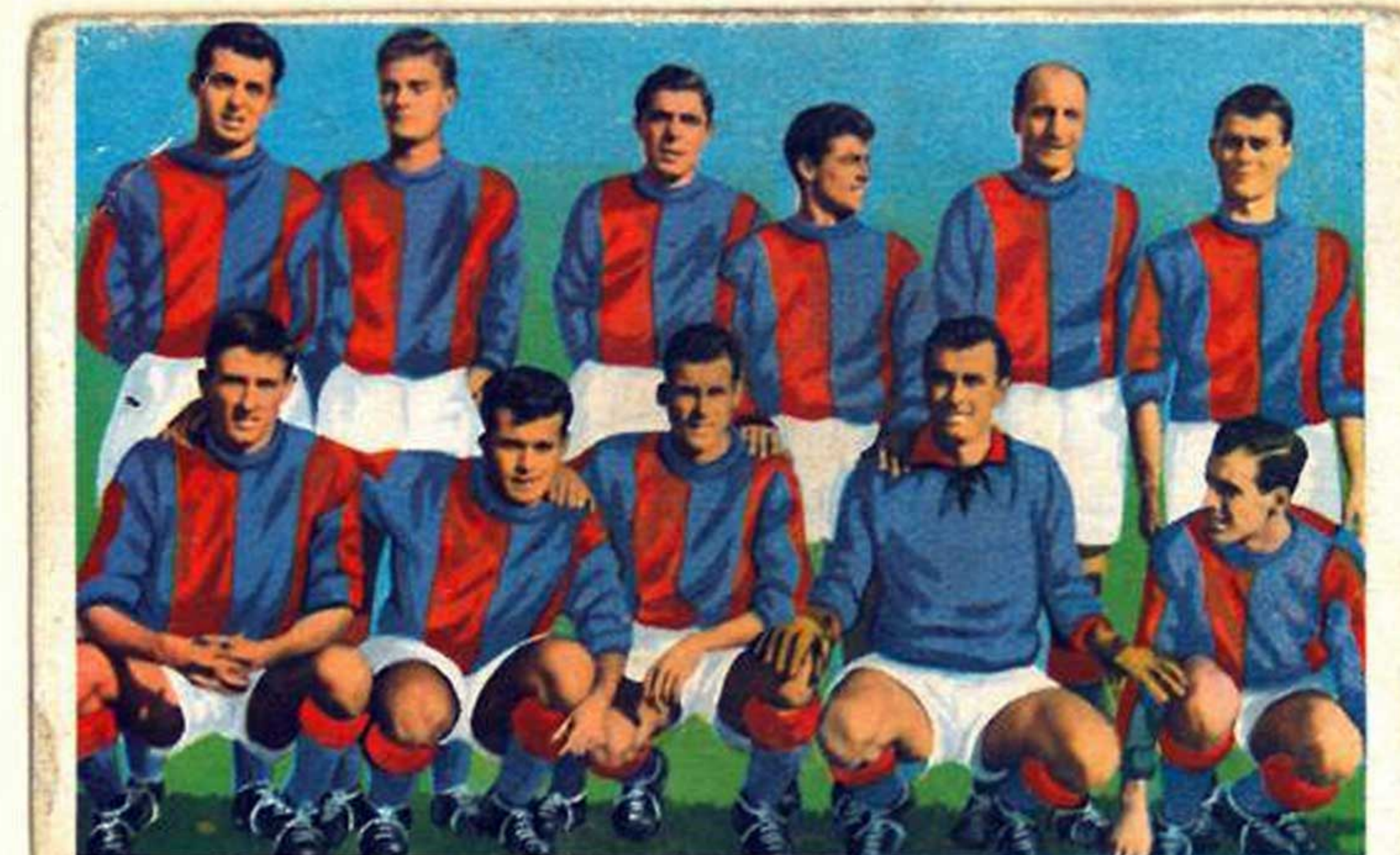
F. C. BOLOGNA

75 - L'F. C. BOLOGNA sorse nel 1909 quale sezione del Circolo Turistico Bolognese ma si rese autonomo dopo pochi mesi. Riportò sei vittorie nel massimo campionato negli anni 1925, 29, 36, 37, 39, 41, ed è l'unica squadra italiana che abbia vinto due edizioni della « Coppa Europa » (1932 e 34) oltre al Torneo dell'Esposizione di Parigi nel 1937.